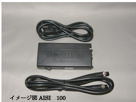
イメージ図 AISI 100

AC in : 100~220V 50/60Hz OUT : DC30V 4.2A